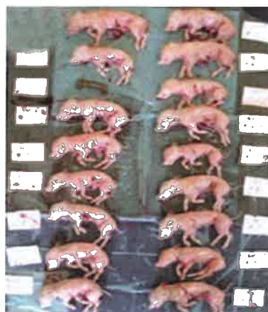
图 A. 2 大小较均一的死胎