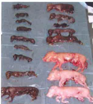
图 A. 1 大小不一致的木乃伊胎和死胎

初产母猪妊娠 90 d 接种 27a 毒株(见图 A. 1)和 NADL-2 毒株(见图 A. 2)显示不同程度的流产病变。